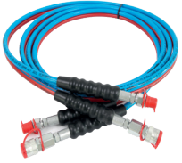
Hidrolik İki Hortumlar Hydraulic Twin Hoses