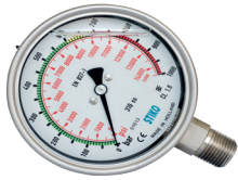
1000 Bar Ø100mm Manometre 1000 Bar Ø100mm Gauges