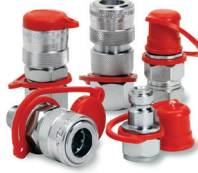
Hızlı Birleştirme Kaplinleri Quick Couplings