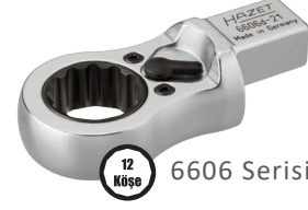
12 Küşe 6606 Serisi

Kare Sürücülü Cırcır [9x12 mm] Square Drive Ratchets [9 x 12 mm]