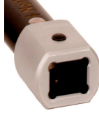
Sürücü/Drive: S3 Değişken Tip Dişi Sürücü Female Torque Handle