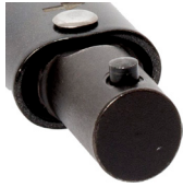
Sürücü/Drive: S7 Spigot Uçlu Sürücü Spigot Torque Handle