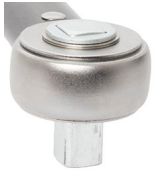
Sürücü/Drive: S6 İtmeli Cırcır Sürücü Push-Through Ratchet Drive