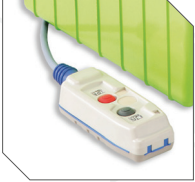
Motor kontrol kumandası Remote pendant