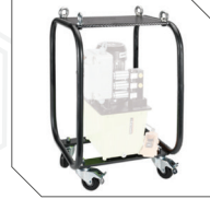
Taşıma arabası Roll bar