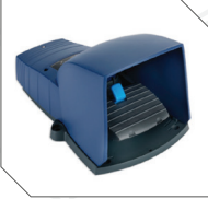
Motor kontrol pedali Remote pedal