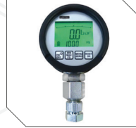
Dijital manometre Digital gauge