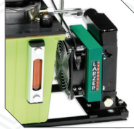
Yağ soğutma fanı Oil cooling fan