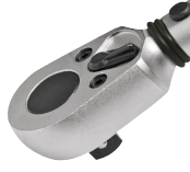
Sürücü/Drive: S10 Yön Mandallı Cırcır Sürücü Reversible Ratchet Drive