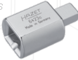
6423-C 9 x 12 mm'den 14 x 18 mm'ye dönüştürücü 9 x 12 to 14 x 18 adapter