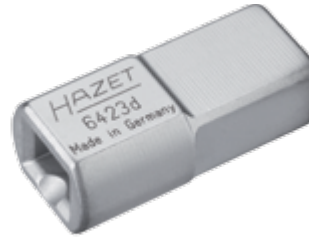
6423-D 14 x 18 mm'den 9 x 12 mm'ye dönüştürücü 14 x 18 to 9 x 12 adapter