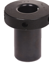
Saplama Tutucu Puller