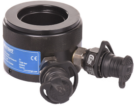
Hidrolik Silindir Load Cell