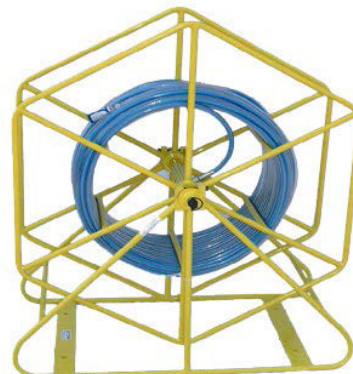
Hortum & Makara Hose & Downline