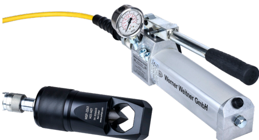
Hidrolik pompa opsiyonel olarak sunulur Hydraulic pump available as an option