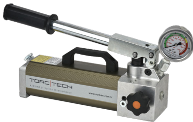
El Pompası Hand Pump