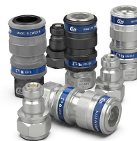
Kaplin Quick Coupling