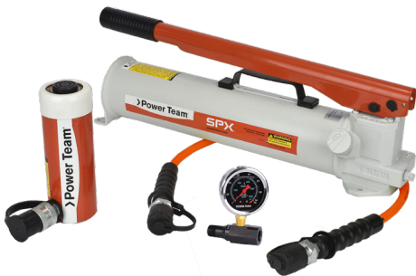
Silindir Seti Uygulaması Cylinder Set Application