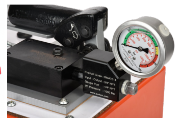
Manometre ve Adaptör Gauge and Adaptor