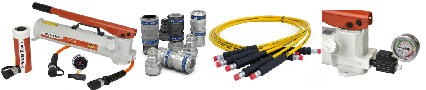
Silindir Seti Uygulaması Cylinder Set Application