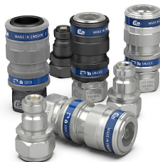
Bağlantı Ekipmanları Connection Equipment