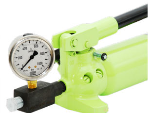
Manometre Adaptörü Gauge Adaptor