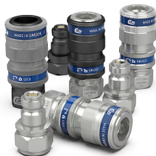
Bağlantı Ekipmanları Connection Equipment