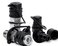
1500 Bar Kaplın