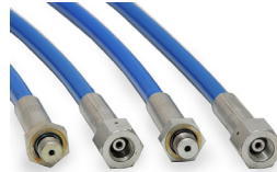
1500 Bar Hortum