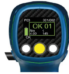
OLED Ekran OLED Display

Açılı Tip Shut-Off Tork Cihazı HST ECO Serisi