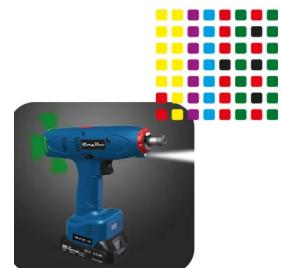
Renkli LED Gösterge Multi Colour LED